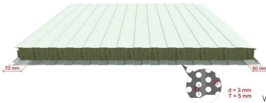
Vista frontal - Front view

Ancho útil 1.000mm. Perfil estándar externo/interno: dogato.